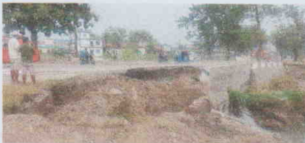
Ch 65+000 Pathari(East West Highway)